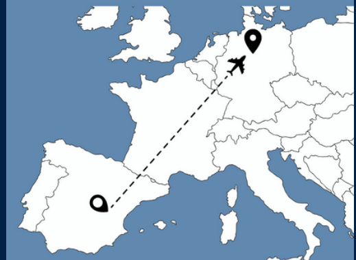
VON SPANIEN IN DIE REGION HANNOVER

Neben uns als BBS Neustadt, die die Spanierinnen in der Schule ausbildet, sind außerdem die Caritas, die Region Hannover, die Städte Langenhagen, Garbsen, Seelze, die Sprachschule Humboldt in Barcelona, die Zentrale Auslands- und Fachvermittlung der Agentur für Arbeit, das Kultusministerium Niedersachsen, das BAMF, die Volkshochschule Langenhagen sowie viele Träger von Kindertagesstätten in der Region Hannover beteiligt. Ein nächster Durchgang ist bereits geplant.